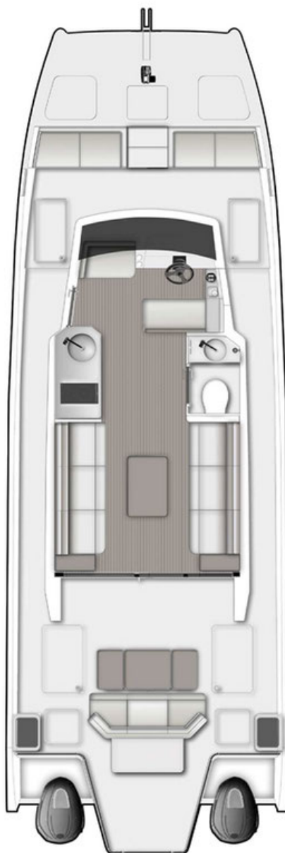
motores fora de borda