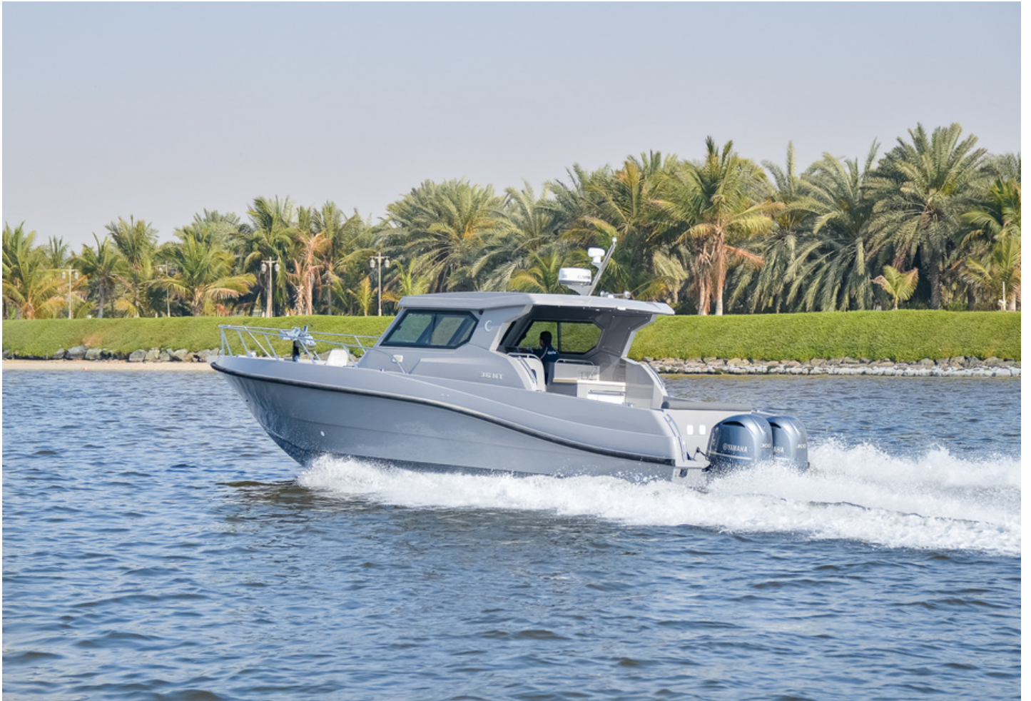
Coast Guard 36