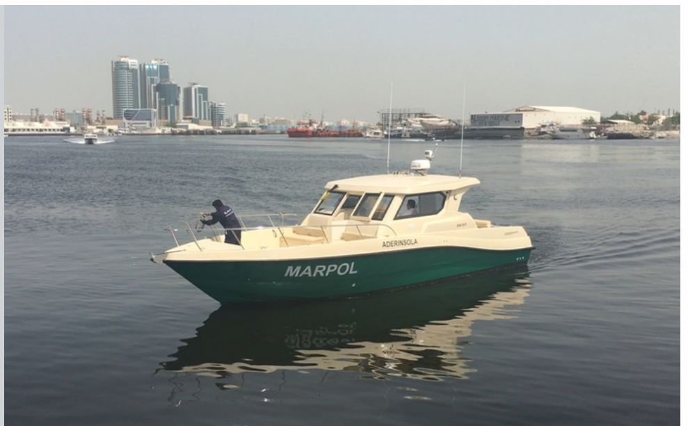
Coast Guard 36